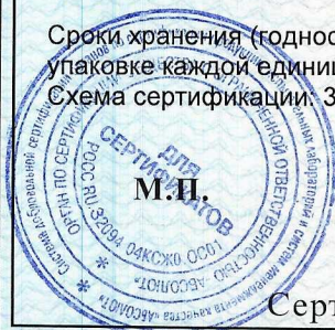
Схема сертификации 3с

Сроки хранения (годности) указаны в прилагаемой к продукции товаросопроводительной документации и/или на упаковке каждой единицы продукции.